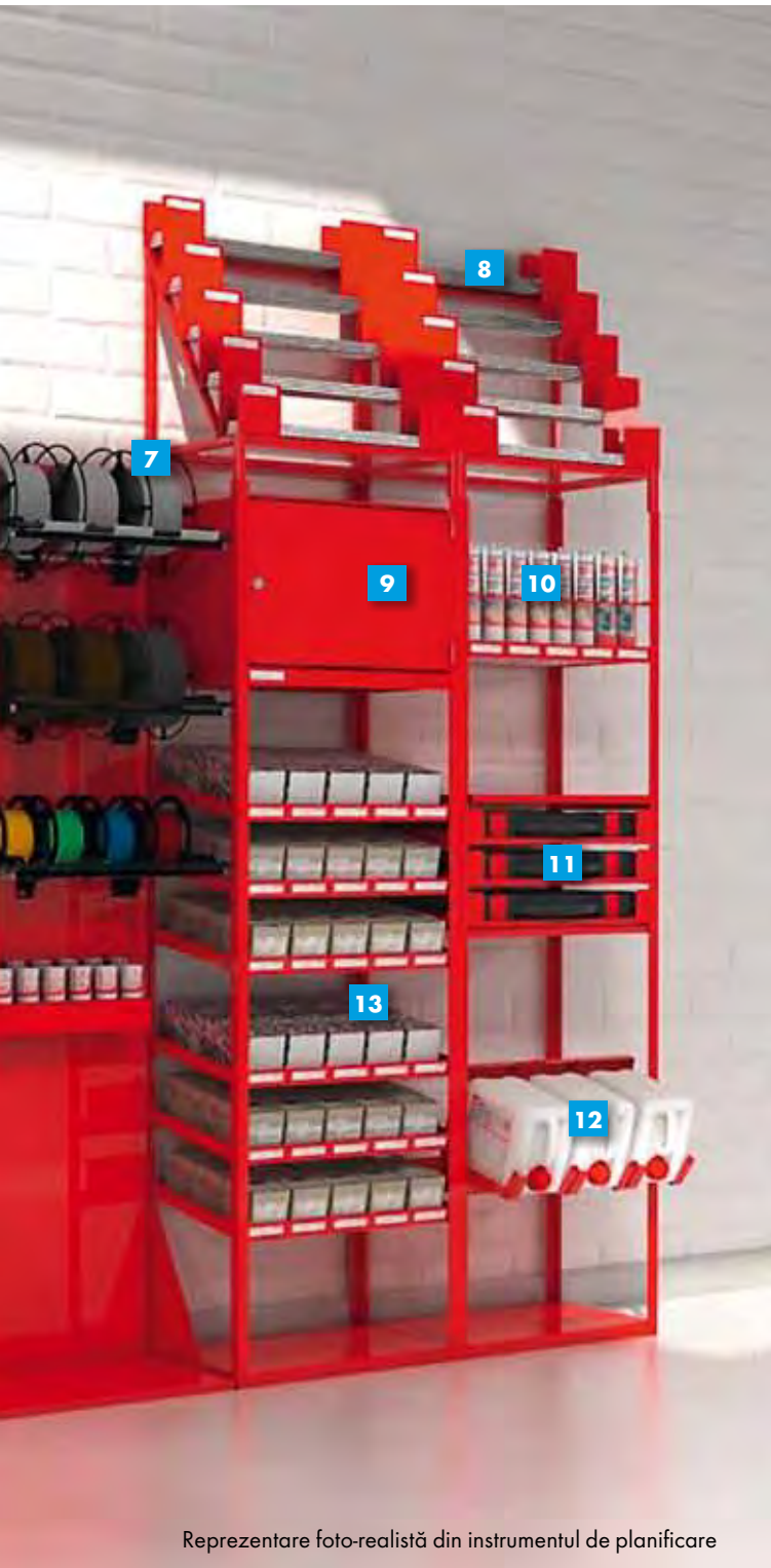
Reprezentare foto-realistă din instrumentul de planificare